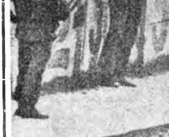
ДЕЛИ Индидэхэи шэнэ атомна электростанци

Орон доторхи эрээдүйн— дүрбэдэхи атомна электрос- таницини хуурида Индийн премьер-министр Индира Ганди туруушын шулуу та- байн байна. Тэрэ Уттар- Прадеш штатдахи Нарорто баригдажа юм. Шэнэ атомна электростаницини онсо юумэ ниний юуб гэхэдэ, Индий бусад энээндэл адли стан- цинуудые барилгада хэрэг- лэгдэгүй гол ёнонуудта тэ- байн проект үндэсэлэнхэй. Энэхэдэ эрдэмтэд голдуу проэктынэе табыа. Өөд тү-