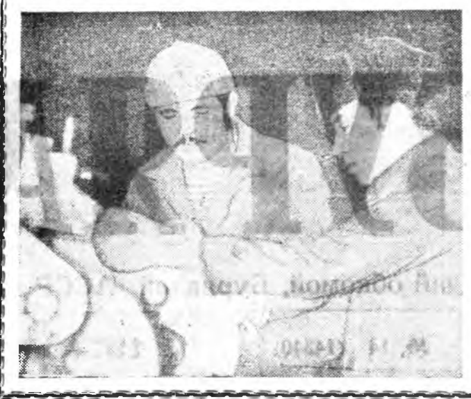
ПАРТИНА ЭДЭБХИТЭДЭЙ СУГЛААНУУД

тогуудхаа 37 мянган центнер үбэн абахан байна. ТИНГЭБЭШЬЕ партиан райкомой, партиан организацинуудай хүдэлмэридэ дутагдахууд олон ушарна. Партиан-эмхидхэлэй, партиан-политическэ хүдэлмэри олон газарта үшөөл үр багатайгаар, ёһын тэдэсэ ябуулагдана. Зарим газарта эдэ бүхы хүдэлмэри үйлдэбэринтэ, түсөө болон социалис уялануудай дүүргэлтэй нягта холбоотойгоор ябуулагдана шадгагданай. Эдэ бүгэдэһөө боложо, зарим промышленна предприятинуудта, колхоз болон совхозуудта ажалай журак адалахэ, тингэжэ бүтээсэ эхэтэн, түгээрэлгүнүдэ наатуулаха, малые хүлэ гаргада оруулаха, таряалангай жаралтай хүдэлмэри танаадуулаха баримтанууд үзэгдэнэ. Эпэнэ тухай элдхэлхэ болон үгэ хэлэгшд ялала тогтоо.