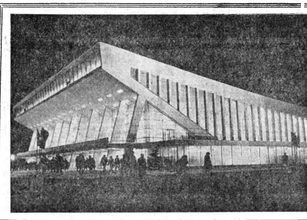
ВОЛГОГРАДАЙ спортын ордон Волгоград шадархи доомо сууда сарахан Мамаев добуундай боорио баригдаба. Энэ байшан илээр, бетоноор алюминээр баригдаа. Досонь гоё найхан юм. Хаягшудын, лотошудын, улазатуудан ишлээтэй. Шайбалай хоккейгээр, фигурна хаурираагаар, волейболдоор, баскетболдоор, футболдоор, гимнастикаар үнээрэгдэжэ нааданууды 3200 хүн хараха байна. Шухала хэрэгтэй болоод байгаа хаань, спортын залы 8 касай турша соо концертнэ зах болжоо хубилхааар тааруулагданхай. Ужам фойе, гардероб, буфет, артистнуудай таалагдууд, дуунууд, телегатай, спортивна шэнжэлэгшэдэй кабинатууд энэ биш. ЗУРАГ ДЭЭРЭ: Волгоград спортын ордон.

линг, паркнууд соо буулгаха, модной 150 килограмм бөрөөсгөй, олон жэлэй ногоной 50 килограмм үрнэ суглуулаха харалаба. Тигрэгэй аймагтай ажалшад газарай хүрнэ найжаруулахын тула гол горхойной, сабшалан, бэлшээрнин захаар олон модо, нөөг бурганаа буулгаха зорилго табиба. А. СУРМАЧ.