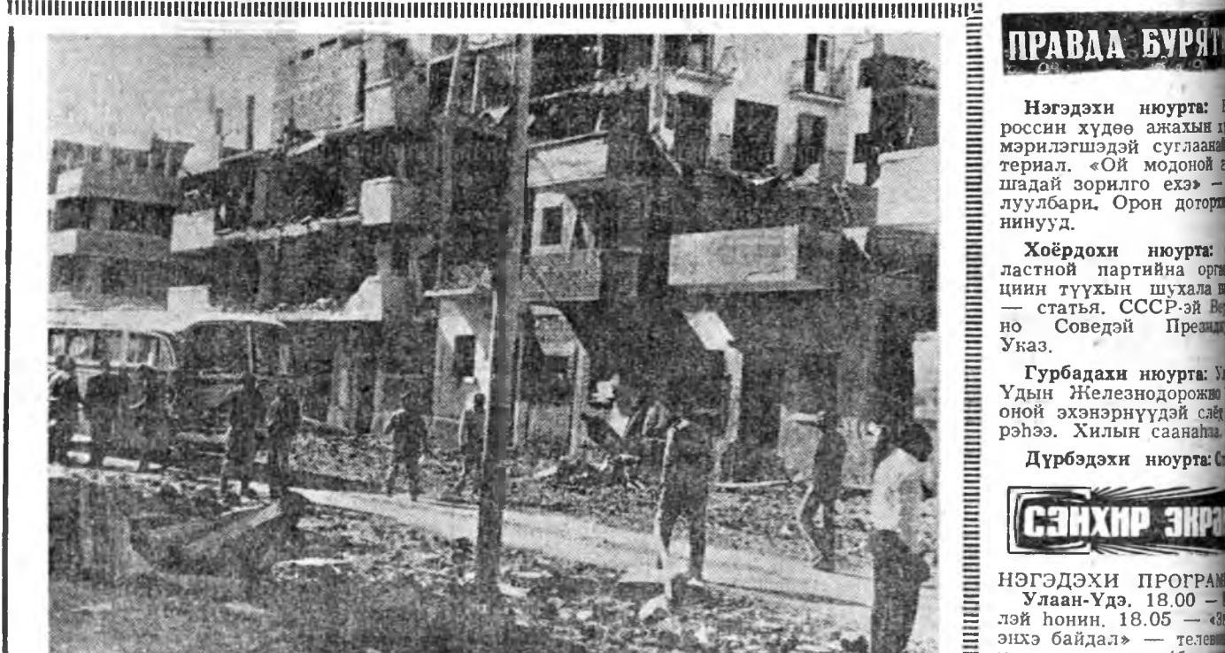
АРЕ. Урдаһы һалбарансэсэглэжэ байһан 300 мянган арад зонтой Суэц город 80 процент хүрэтэр һалбаргагдһан байна. Эндэ Израилин бомбо, снаридуудта дайрагдангүй үлэһон нэгэшыне гэр үгы шахуу. Мүнөө эндэ һалбарилгын худэмэришан үргэнөөр ябуулагдажа байһаы. Бүри һалар Суэц город һалбарлаһаа сүлөөлгөжэ, шэнээр Һэргэнэ ТАСС-ай фотохронико.

КУАЛА-ЛУМПУР Совет парламентаринар Малайзида ТАСС