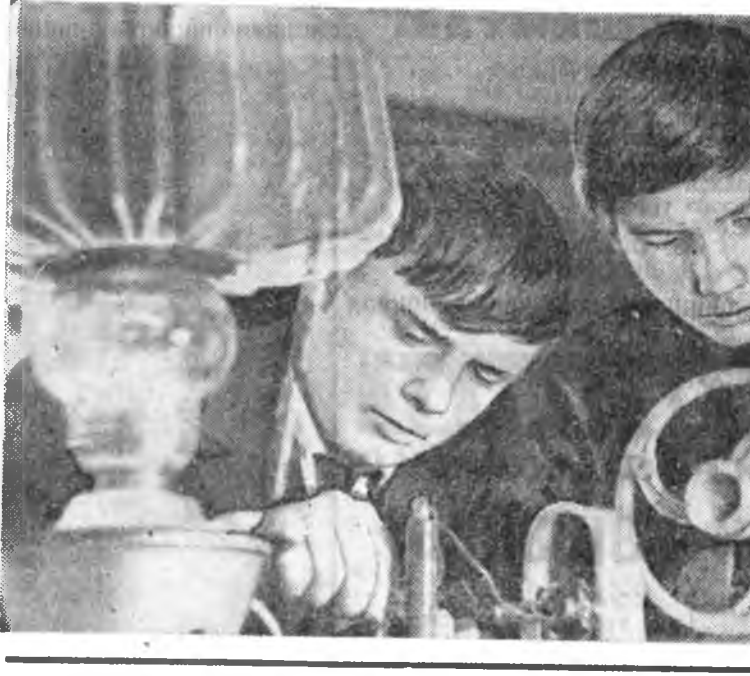
Хургуулиһаа ерэнэн бэшгүүдхэ