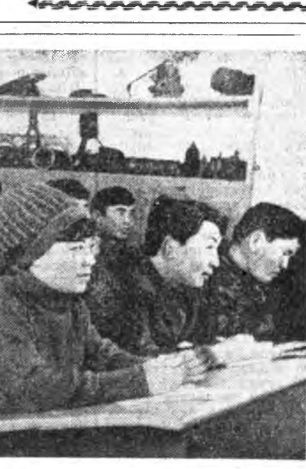
ЗУРАГ ДЭЭРЭ: механизаторнуудай бүгдэд нийтэн...