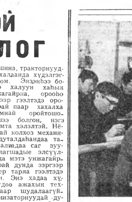
ЗУРАГ ДЭЭРЭ: механизаторнуудай бүгдэд нийтэн...