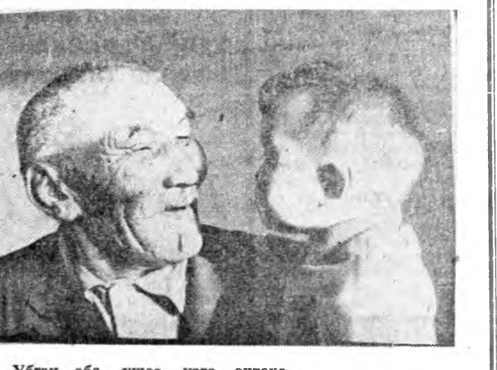
Убган аба, үшөө нэгэ онтохо.

Н. ДОНСОРУНОВА, республиканска бүлгэмые даагша.