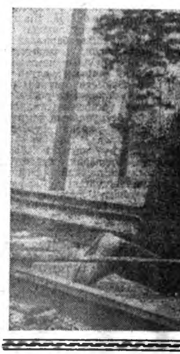
Улаан-Удын шэлэй заводо...

Манай аймагйя партийна организацинууд эрдэмэй туйлануудые ба туруу ажалшаддай дуршулше үргээр шудалха ба нэбтрүүлхэ хэрэгтэ эхээн анхарал хандуулаг юм.