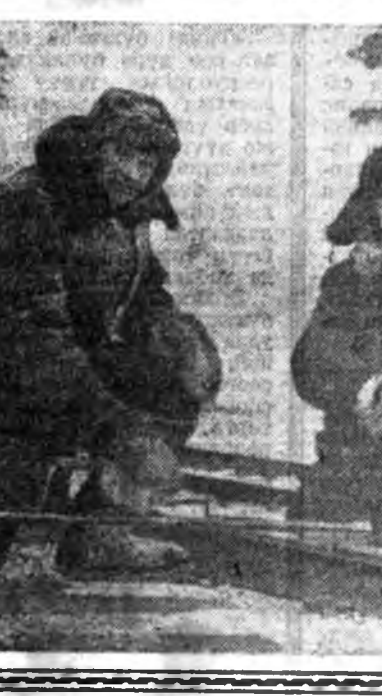
Улаан-Удын шэлэй заводо...