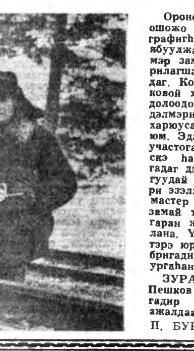
Улаан-Удын шэлэй заводо...