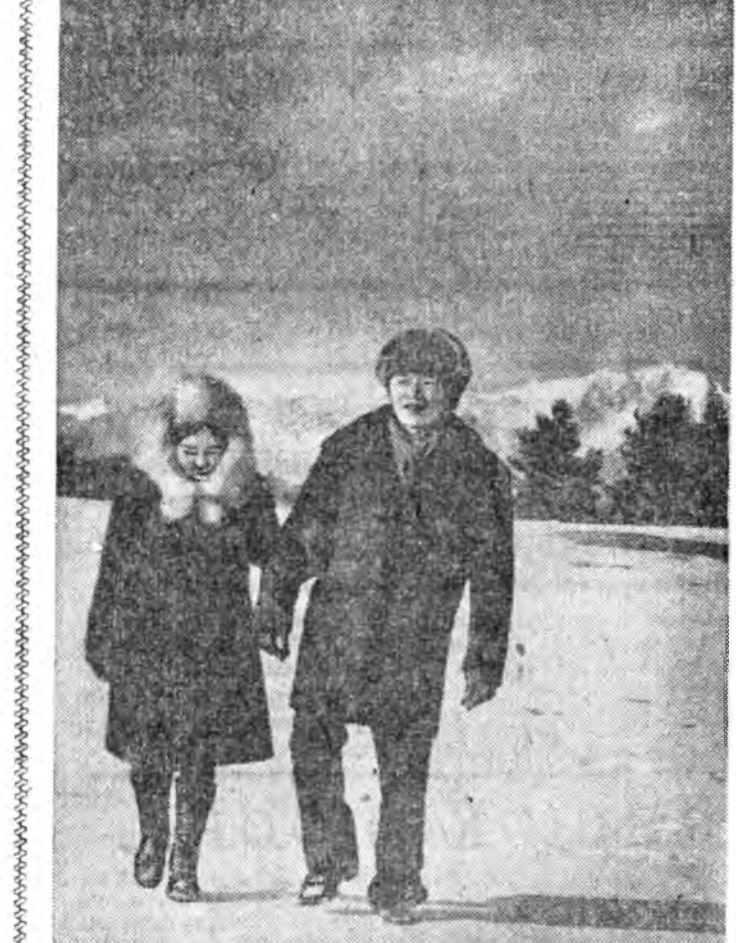
Урдаһан буряадуудай урданай дуунууд

Хамагынь яагаа шэрүүн бэ. Хайрлаһан хүгшэниие харахадам, Хатанхай эжым наһагдана. ЭГЭТЭЙ НЮТАГ ТУХАЙ Эрэлэн эрэлэн харагдаша Эгэтын хойто хада юм даа.