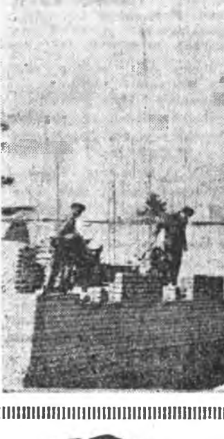
Барилгашад хайн шанартайгаар амжалнад...