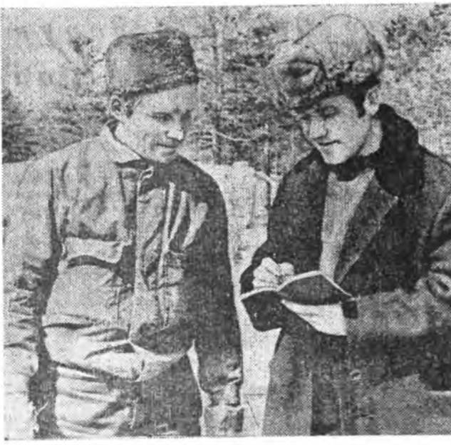
Барилгашад хайн шанартайгаар амжалнад...