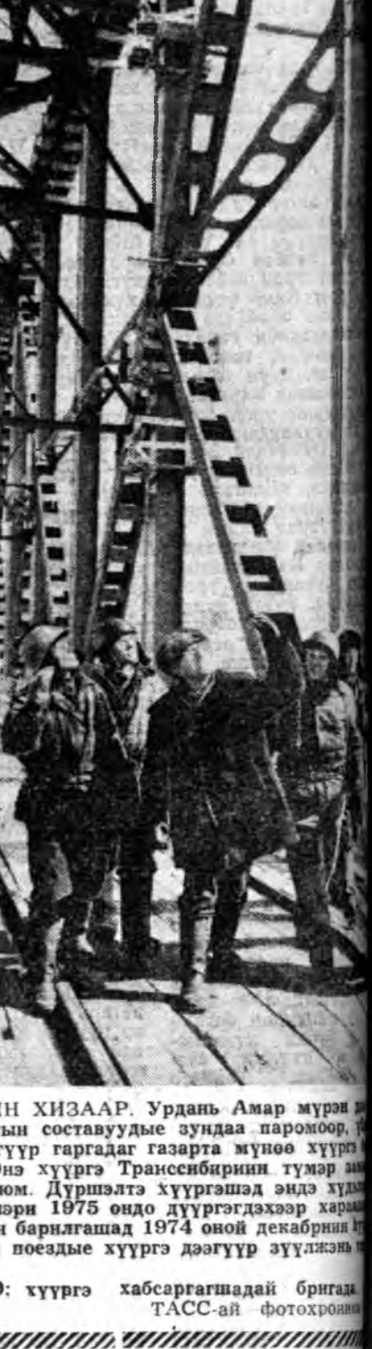
ХАБАРОВСКИЙН ХИЗААР. Урдань Амар мурэн гургуур түмэр харгын составуудые зундаа паромоор, нүүдэ мүнэн гэдүүр гарадаг газарта мүнөө хүүрэн ридлага байна. Энэ хүүрэн Трансисибирин түмэр нэ оевенда хүртэхэ юм. Дүршэлтэ хүүрэншээд эндэ худалхэришээд барилгын худалхэришээд 1975 ондо дүүргэгдэхээр харна динхай юм. Харин барилгаад 1974 оной декабрын 16-даа бусага зоригтотой.

Энэнидэ эхээр өрөглө тарнай абажа болохо гү? ВАСИЛИЙ-ай вице-президент академик И. Н. Сивинг Кудундин тэдын 165 мянган гектар газарые үналха наа, аша үр гараха гэржэ тоолоно. Мүнөө эрдэмтэд энэ тэдын газарай үржэл