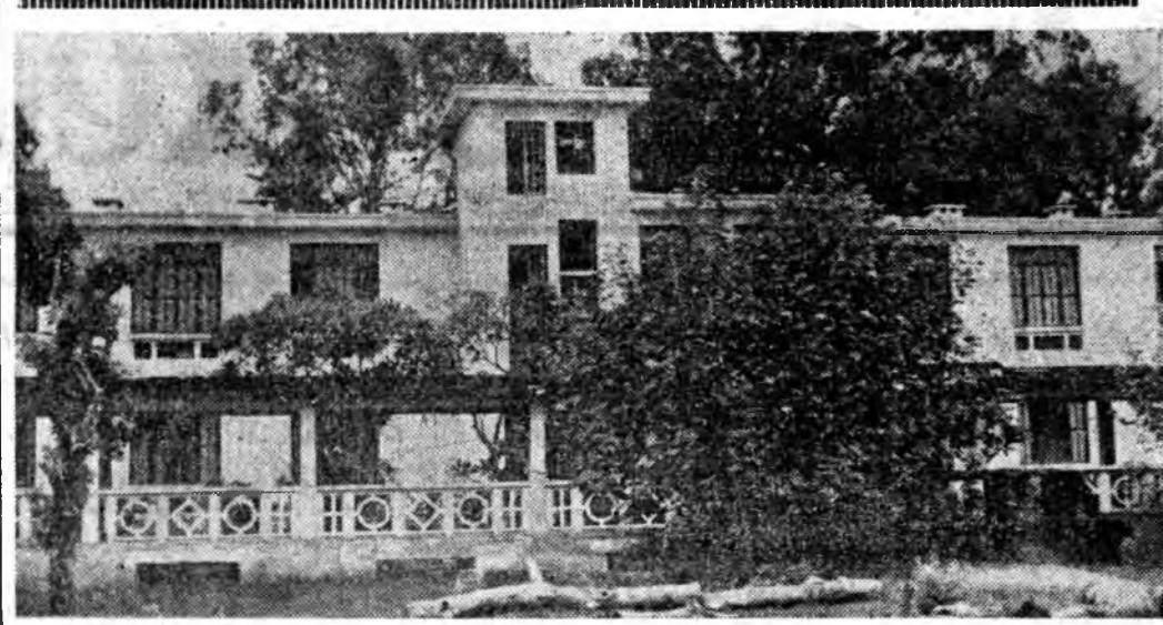
ДРВ, Унгарын дайнай үед Ханови Батмэй болонца эхээр...