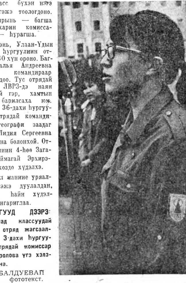
«Ажал мание урлална!» гэжэ дууладан, үхнүүдэ һайн хүдэлхээ тангариглаа.