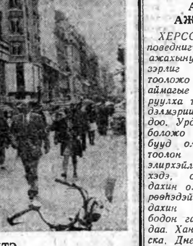
Франциин нийслэлэй үйлсэнүүдтэ Парижгай год гудамжадахи Елисейскэ талмай дээрэ оршдог «Аэрофлот» түлөөлэгшын зураган.