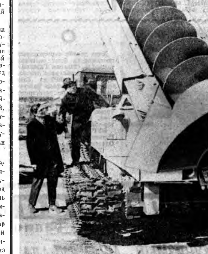
ИВАНОВО. Ехэ хүсэтэй электрын элшэ хүсэ дамжуулаха линини тулганууды табиаа лүхэ малтахи тулада «Главэнергостроймеханизация» гэлэн механическа завод «МРК-750Т» гэжэ машинанууды олоор бүтээн гаргаха эхнээ. 3,5 метр гүнзэгы, 750 миллиметр диаметртэй нүхэ малтахын тулада тэрэ 3-на 5 минута хүртээр саг гаргалдаг. Тус агрегат ТТ-4 тракторай шуур дээрэ хабсагданхай. Энээнэйгээ ашаар тэрэ шинг нойтоор эхэ газарташье хүдэлжэ шадха.

дай, мүн үбнэ тэгшэл байдлыг хангаха ажалшадтай соёлой эрилтэ хангаха юм. Зунай үдэ нууаалин ехөөр дээршад, бэлшэн таргалуулагдааг малай шөгүүрэй найнаар намадаг байны хараада абажа, совхозуудай партиань организацинууд болон профсоюзай рабочымууд малшадтай дунда дөлгөршэн социализм мурсыонэ зүбөөр ударидаха, агитаторай талмайнууд болон навильонуудай, мүн соёлой, медицин, худалдаа наймаанай, ажагуудай малшадта газете, журналууд хуларгалжэ хангадаг худалмэригшэдэй ажал хинан шалгаха болоно.