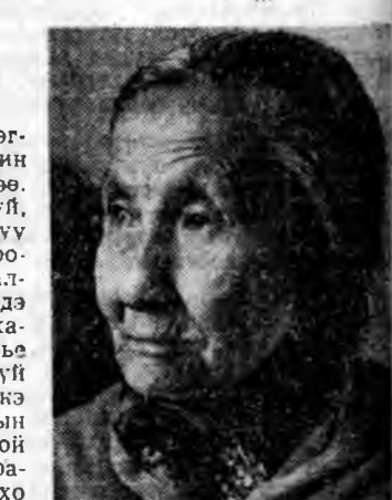
Тэрэ гэлээр 50 жэл үгэрбэ. Тинхээдэй партида ордон хүнүүдэй олонхын бидэний дунда үгы. Гэбшье амиды эндэ ябаһан коммунистуудые бэдэржэ, тэрэнай хуби заяан тухай хэрэглэ хэсүлэнтэй бэдэрэл хээ һэмди...

УЛААН-ҮДЭ. Пушкинай гудамжа. 19-дөх гэр. 66-дөх квартира. Сагаан тархитай буряад эхээр үүдэ нээшээр бидэнине гэртэ орохысман уриба. Тэндэ ариг сээр, телевизор хүүхдэр талаараа таһалга гэрээлүүлэнэ.