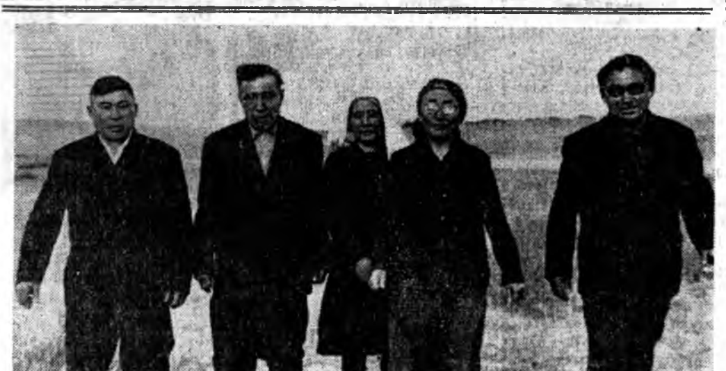
Унгаргшэ жэлдэ би харууһалжа байһан үнээн бүрибөө 2713 килограмм һу һаһан байһаб. Энэмин ур-занда жэлһинхээ 415 кило-граммаар ехэ. Бин байгаа арга болжонбуудаа зүбөөр