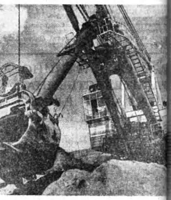
Уялгая болзорһоонь урид дүүргэбэ