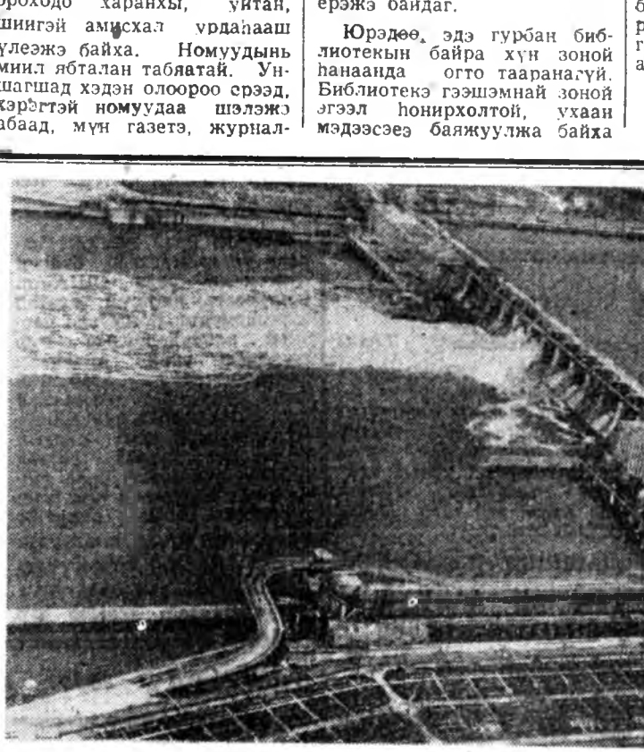
Дунай мурэн дээрхи «Железные ворота» гэжэ гидростанци дэлхэй дээрэ томо электростанцинуудтай нэгэн юм. Энэ ГЭС-ые Румыни болон Югослави Советск Союзай аха дүүгэй туналамжаар хамтадаа бодхон байна.