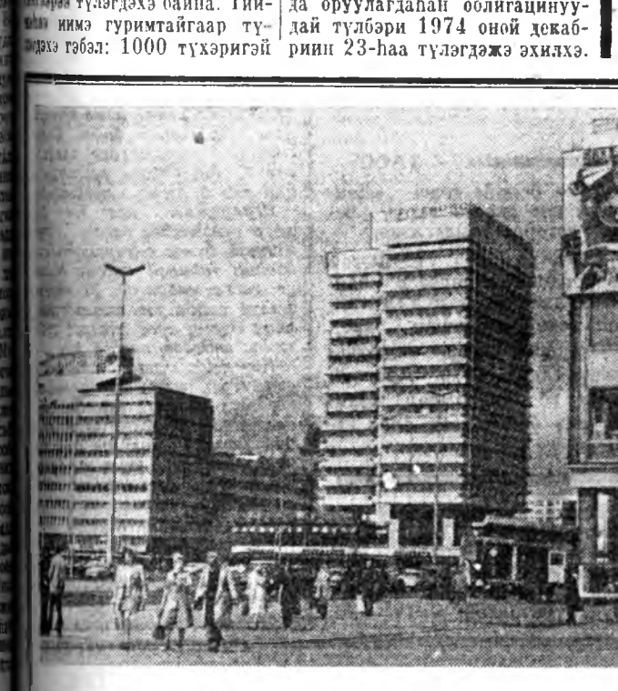
Бухарест. Бырлад хотынхид эдэ үдэрнүүдтэ хотынгоо байгуулагдаан 800 жэлэй оие тэмдэглэжэ байна.