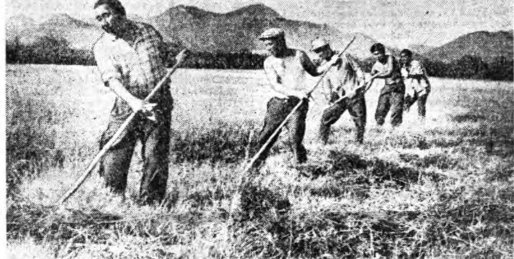
Убһэ ногооний түлэг ургаяа байха үедэ манай эндэ хура бороо үни удаан ороогүй. наран үдэрһөө үдэртэ шангаар шаржака, добо газарай ургасые эхээр хатаагаа. Шинг нойто эл бөгтэй байһан жэлдэ 3-4 һури үбһэнэй гарадаг гаяар һаа мүнөө оройсоод нэгэн-хоёр һури үбһэн абтана.