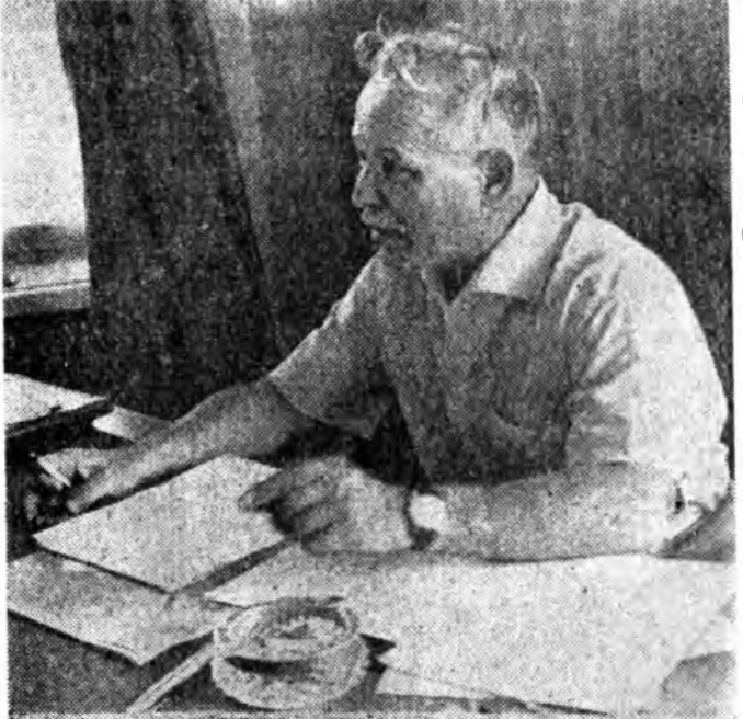
Урган зоёолой ба нийтэн ажал ябууллага үргэлж- лүүлхээр. ЗУРАГУУД ДЭЭРЭ: Ве- щенская шадар Дон мурэн дээгүүр баригданан понтон- но хүүргэ; М. А. Шолохов хүдэлмэрингөө кабинет соо; Вещенская станцийн шэнэ Соёлой ордон. ТАСС-ай фотохронико.

Энэ нотагта түрэн, урган ехэ болон М. А. Шолохов мүнөөшэ Вещен- ская станцада ажабууна.