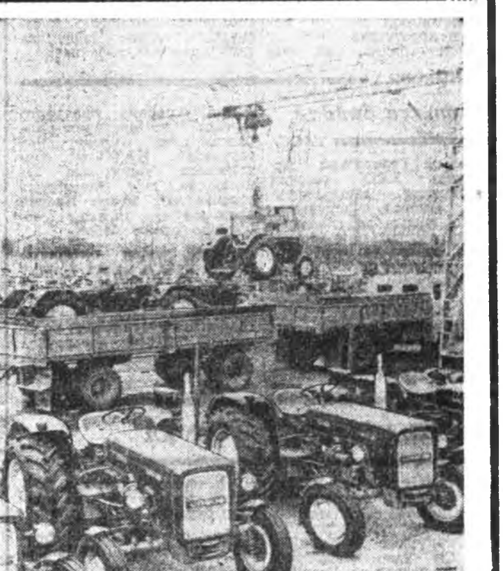
Урсусуу машинна бүтээлгэн бүтээгдэнэ...