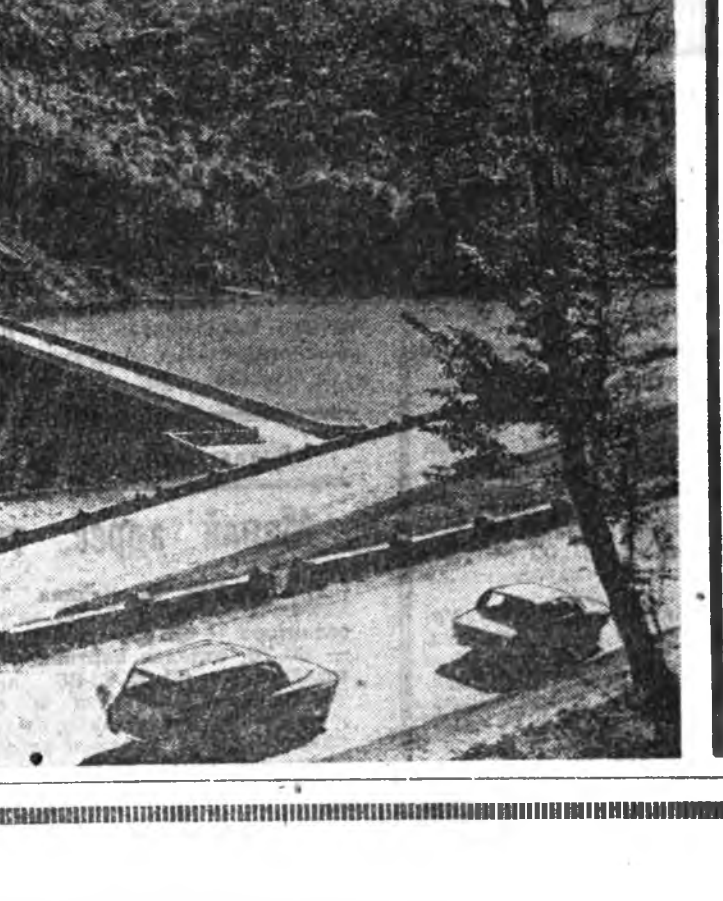
Узбекфильм студия тавина...