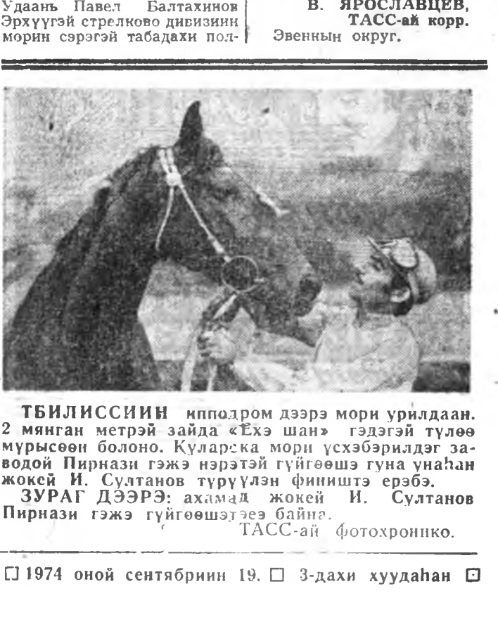
Тбилисний ипподром дээрэ мори урилдаан...