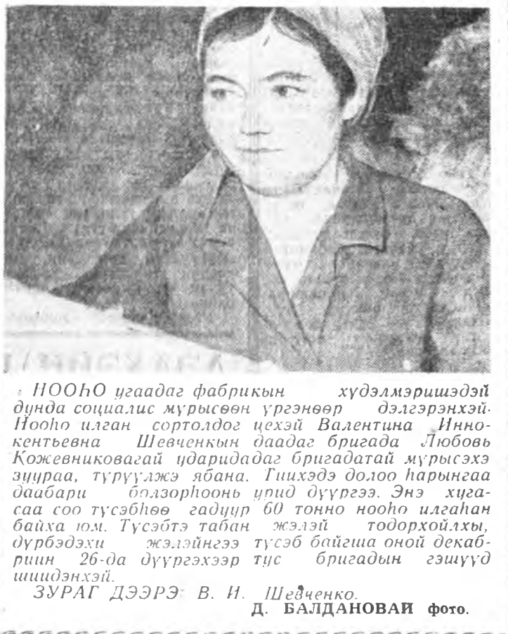
НООНО цаадаг фабрикийн хүдэлмэришэдэй дунда социалис мурысөөн үрэнөөр...