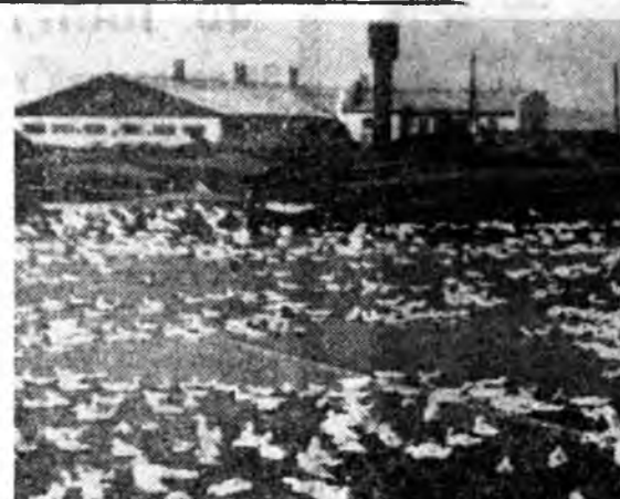
Сав зой шубуушад энэ жэлдэ нэгэ миллион г гаран нугаа үдхэжэ, гүрэндөө тухааба. Зураг дээрэ: Твороговско фермын наар гүрэн тэгушаагдажа нугаһад дальбара дэгжээхэ байра оборогдоно.

13-дахы салин хүсэдөөр абахын тула үйлдэрингөө түсбэ дүүргэхэ, 3 жэлнээ дошо бэшэ хүдэлмэршын стайтай байнаа.