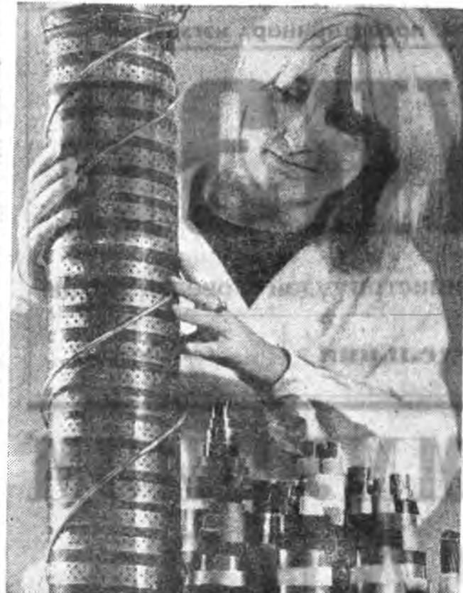
«КАМКАБЕЛЬ» заводто (Баруун Ураал) 800 мянган...