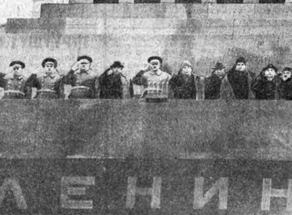
МОСКВА, 1974 оной ноябрийн 7. Улаан талмай. ЗУРАГ ДЭЭРЭ: В. И. Ленинэй Мавзолейн трибуна дээрэ.

ветеранууд, граждан динэй ба Эсэгэ ороноо хамгаалгын Агууехэ динэй баатарнууд, ажалай баатарнууд, Московско предприятинуудай, Москва шадарай сонхоозуд болон колхозуудда түрүүшүүл, эрдэм болон соёл ажал ябуулагшад, космонавтууд харагдана. СССР-тэ байдаг дипломатическа түлөөлэлгэтэ эмхинуудай толгойлогшонор энэ мүн лэ бии.