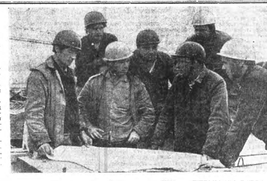
ЛЕНИНГРАД. СССР-эй барилгын министрствой Главлестройн Эб-дахн трестин коллектив үйлдэбарингөө даабаринуудыг амжалтаар дүүргэнэ. Түсбэтэ юндэхн табан жэлэй эхилхэндэ хойшо энэ коллектив түсбөө гадуур 35 барилга ашаглалагда ушаабан, ажалланта бүтээсэ 24 процентээр дээшэлүүлэн байна.