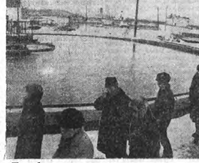
Уһа сээрлэдэг түхээрлэгшэн дэргэдэ.

Хоёрдохи ПРОГРАММА Улаан-Удэ. 19.30 — «Рейвранд» — телевизионно жүжэг. 21.15 — «Дууһаа дурда хүртээр» — жүжгэй фильм.