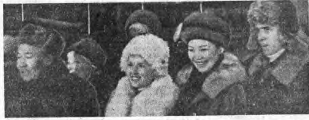
Буряад, ород драмын театрай артистнууд картоной комбинадай цех соо.

Бордоолно. Автобусууд дардам харгын утые эбхэнэ. Улаан-Удэ хотымнай урай зохиолшод, артистнар, композиторнууд, уран зураашад Сэлэнгын целлюлозокартоной комбинадай хүдэлмэрлэгшэдтэ айлыаар ер-бэ.