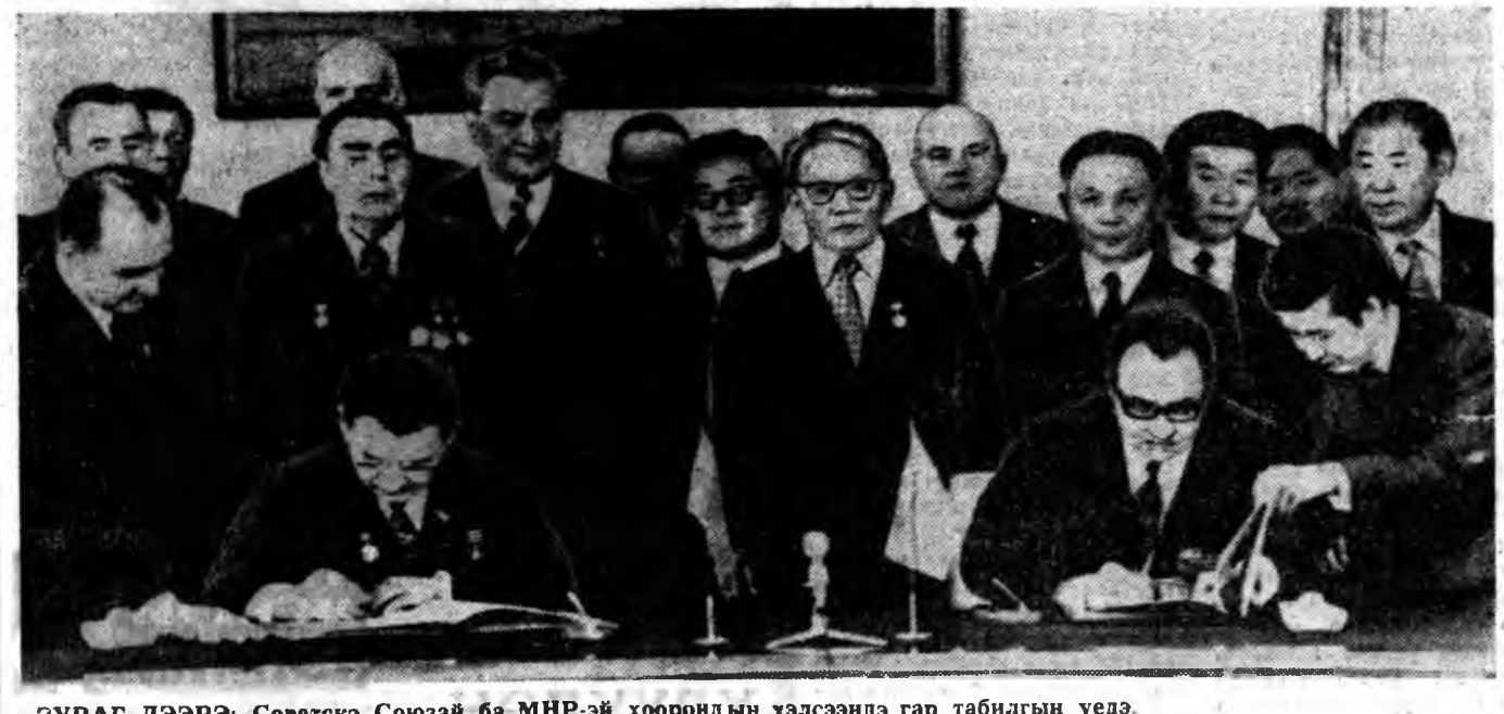
ЗУРАГ ДЭЭРЭ: Советскэ Союзай ба МНР-эй хоорондын хэлсээндэ гар табилгын үедэ. Фототелеграфар абтаба.

Монголой Арадай революционно партиин Центральна Комитетэй Нэгэхи секретарь, МНР-эй Арадай Эхэ хуралы Президиумай Түрүүлгшэ нүхэр Ю. ЦЕДЕНБАЛДА МНР-эй Министрүүдэй Советэй Түрүүлгшэ нүхэр Ж. БАТМУНХДА Хүндэтэ нүхэд! Аха дүү Монгол оройной газар дайда дээрһээ бусахада, Советскэ Союзай партийно-правительствена делегациянын хүндэмүүшэ халуунар утгаһанайн тулөө Таһаада, МНР-эй Центральна Комитетэй, МНР-эй Арадай Эхэ хуралы Президиумай, МНР-эй Министрүүдэй Советэй, бүхы монгол арада үнэн зүрхэнэй байр баяхалаһаа хүргэжэ байһанаа үшөө дахин мэдүүлэдмд. Биднэй хабаадаһан, МНР-эй III съездын болохоор, Монголой Арадай Республикын тогтоогодоор 50 жэлэй ойе һайндэрлэлгэ социалист Монгол оройной гайхамшагта тулгалануудай, эбдэршгүй совет-монгол хани барисаанай тооломо гэршэ боложо үнгэрөө. МНР-эй XVI съездын шиндэбэрнуудын бодото дээрһэ бөөдүүлгэдэ, МНР-тэ социализм байгуулгын дүүргэжэ замда, Азида ба бүхы дэлхэ дээрэ эхэ найрамдал, аюулгүй байдал хангахын тулөө тэмцэлдэ шэжэ гэжэ амжалтанууды туйлаһан Монголой Арадай-революционно партида. Тамай оройной бүхы ажалшадта хүсэнэдмд. Аха дүү монгол арада зол жаргал, һалбаран хүргэһэн хөөрөөдмд, КПСС-эй ба МНР-эй Советскэ Союзай ба Арадай Монголой хоорондохы хани барисаан, харилсаа холбоон хүгжэн һалбарга! Л. БРЕЖНЕВ, А. ГРОМЫКО, Д. КУНАЕВ, Т. УСУБАЛИЕВ, Н. НОВИКОВ, И. АРХИПОВ, Н. БАННИКОВ.