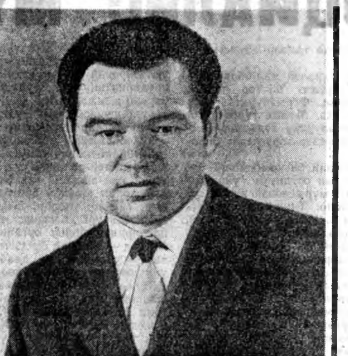
«Союз-17» онгосын командир Алексей Александрович Губарев (зүүн гарһаа) ба бортинженер Георгий Михайлович Гречко.