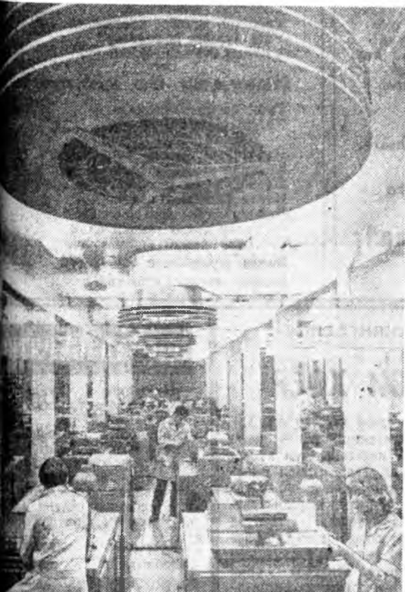
Техническэ дэбжэлтэ, шанар