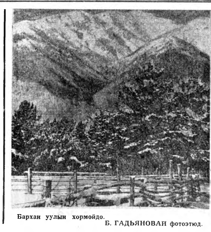
Бархан уулын хормойдо.

Забхай Балхин харгыгаар Зайжа нэгтэ абатараа Золгожо Сахан басагантай Зулгыгаар зугаалаа урматай. Хүүхэн, хаанаахаа ябанабта, хургэхэдэ танине болохо гү? Хөөрхэн нюдэнэйш галханууд, Хайлуулан байнал зүрхыем. Оо, хайлуулаа! Интэж худал үгөөр Эрэйулоб басаганай тархи.