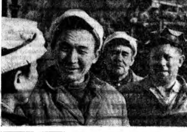
1974 ОНОЙ ТҮСЭБ ДҮҮРГЭГДЭЭ

1925 оной ноябрин 15-да морин сэрэгэй тургуули дүүргэлгэн баяр ёнолол болоо.