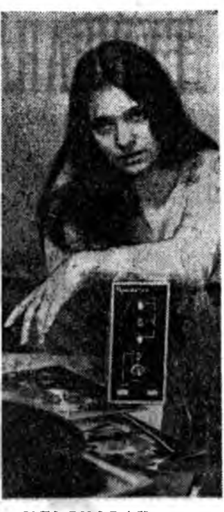
УЛЬЯНОВАЙ прибор бүтээгч...