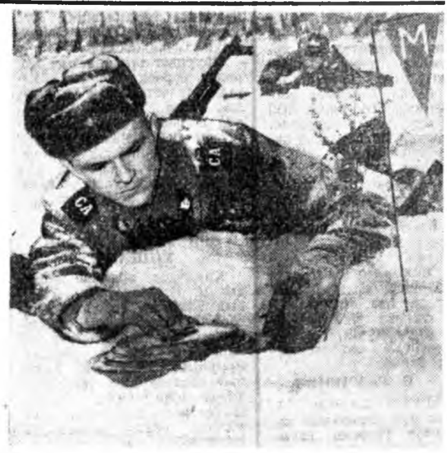
УЛААН ТУГТА СИБИРИЙН СЭРЭГЭН ОКРУГ. Сибирийн сэрэгшэд гвардейцүүд-забанильцуудай үүсхалы халуунаар дэмжжэ. Сэрэгэй хуралсаал зорилгонууд болон нормативууды эрхмээр дүүргэхэ, техникэ болон сэрэгэй хэрэгслүүды аша үрэтэйгөөр хэрэглэхын түлөө тэмээлы тэднээр шуулын шуудалда тоолохо гэжэ шийдэнхэй.

ХАРИЛСААГАА УЛАМ БЭХИЖҮҮЛХЭ Советскэ Союзай, Английн хүтэлбэрилэгшэдэй хоорондо Москвада болоһон хоёрлэдөөнүүдэй дунгууды дэлхэйн олонитэ хайшаан шэржэлээр. ЛОНДОН. Английн ба Советскэ Союзай хоорондо шэнэ хани барисаата политическэ харилсаан тогтожо байна гээд «Гардиан» газетэ бэлэнэ. Хоёрлэдөөнүүд амжалттайгаар үнэрөө гэжэ «Ивинг» стандард» газетэ тэмдэглэнэ.