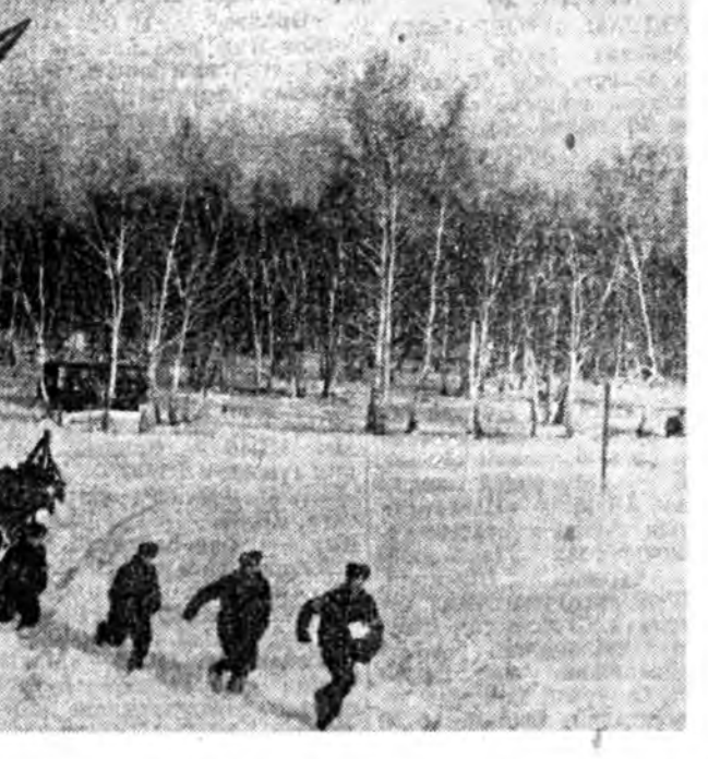
Улаан тугта сибирин сэрэгэн округ. Сибирийн сэрэгшэд гвардейцүүд-забанильцуудай үүсхалы халуунаар дэмжжэ. Сэрэгэй хуралсаал зорилгонууд болон нормативууды эрхмээр дүүргэхэ, техникэ болон сэрэгэй хэрэгслүүды аша үрэтэйгөөр хэрэглэхын түлөө тэмээлы тэднээр шуулын шуудалда тоолохо гэжэ шийдэнхэй.

Социалис Эхэ оронойгоо эрхэ сүлөө ба бээ даанхай байдалтай түлөө тэмээлэн манай арад ба тэргэний Зэбэсэт Хүсэнүүд сүлөөлэлэе. Интернационална ехэ үүргэ дүүргэе. Манай армийн иелтэ түгэс довтолгонууд Европ түгэс зуураар эзэмдэгдээд байхан оронуд: Югославия, Польша, Чехословакия, Албани, Франци, Итали болон бусдай патриотическэ хүсэнүүдэй сүлөөлэлэе түлөө тэмээлы асаашдаа үргэдхэхэ хэрэгтэ тууланхай байна.