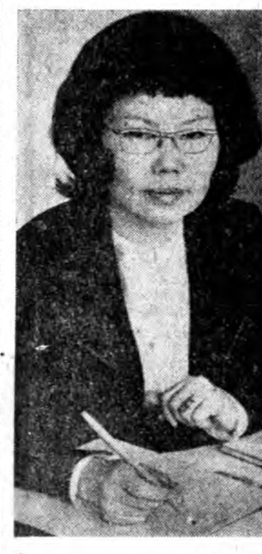
ЭХЭНЭРНҮҮДЭЙ УЛАСХООРОНДЫН ҮДЭРТЭ ЗОРКУЛАГДАНА