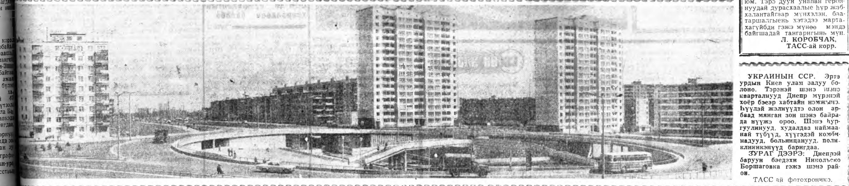
«БУРЯД ҮНЭН» □ 1975 оной апрелин 1. □ 3-дахы хуудһан □