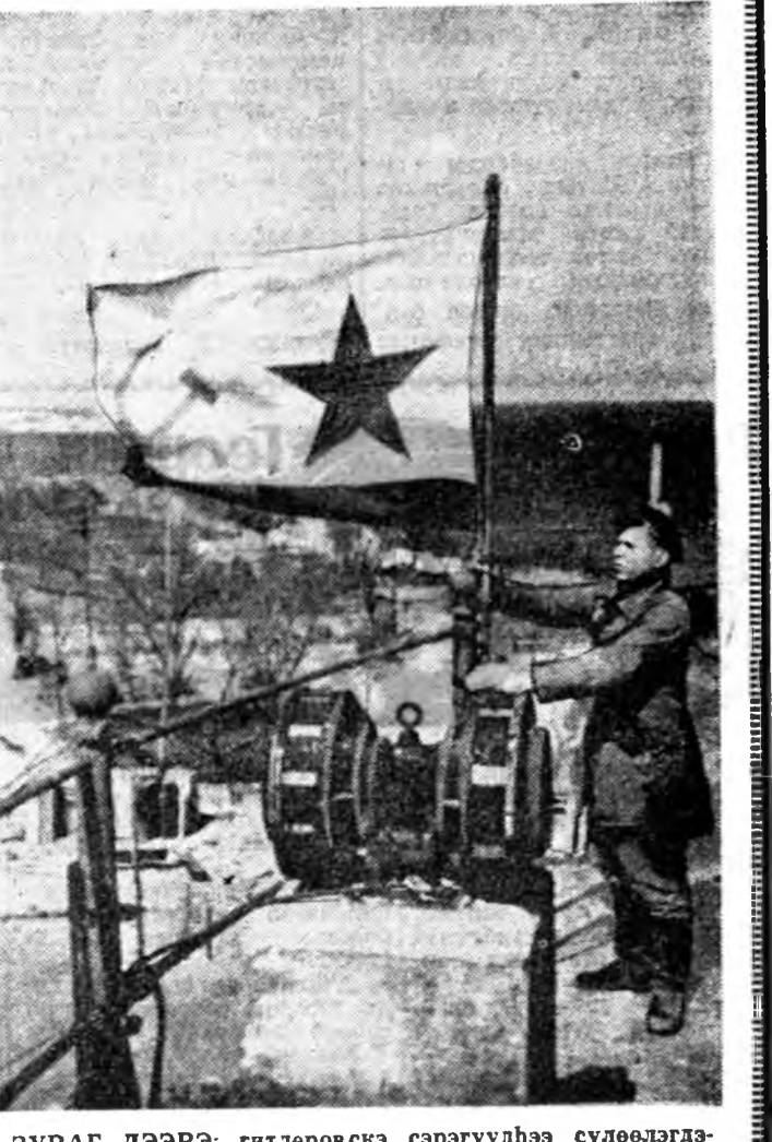
ЗУРАГ ДЭЭРЭ: гитлеровскэ сэрэгүүдхэ сүлөөлгшэдэн Севастопольдо совет далайн-сэрэгэй туг мандуулагдажа байна (1944 он).

Улаан Тугай орденотой Хара далайн флотой морьтууд океан, далайнуудаар үдэн саг соо тамаран, дайшалхыг нуралсаалайгаа зорилонүүдыг бэлдүүдэн, Эхэ оройнгоо нинг найхан бэрхшээл зүрх сэдхэлдээ хадгалма абаалт. (ТАСС).