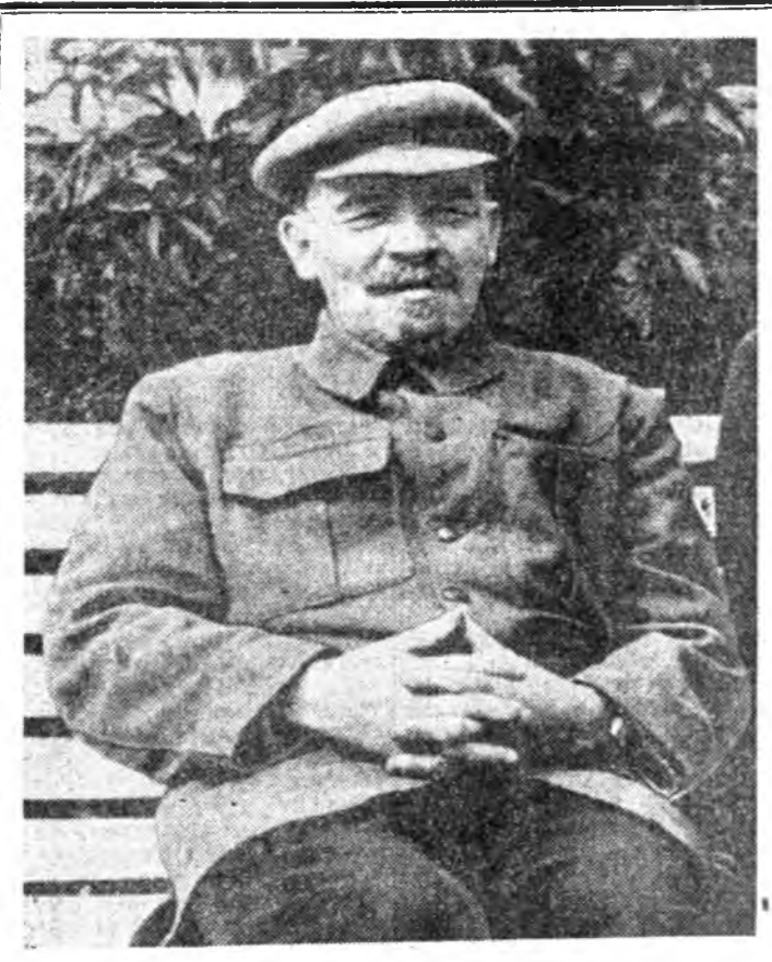
В. И. Ленин. 1922 он, августын эхнй. Горко.

(1975 оной Майн 1-дэ зороулжа, КПСС-эй ЦК-гай гаргалан Ураануудһаа).