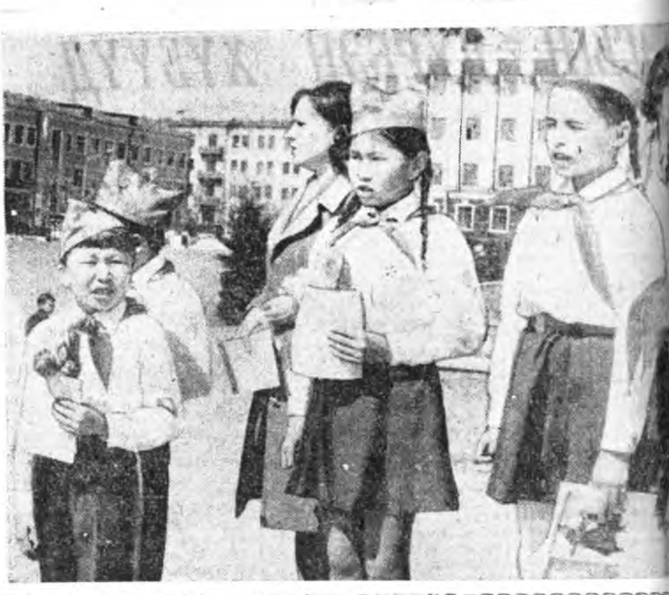
Пионервожатанууд, багшанар, түрэлхид октябриярта улаан галстуугаадые зууб. Тинхэдэнь эдэнэр Эхэ орондоо, түрэл партидаар ходоодо үнэн сэхэ абаар шайха тангарида үгөө.

бүхэсоюзна пионерүүдэй эмхин зэргэдэ ороходоо, хани нүхэдэйгөө урда оморголх байртайгаар тангариглана... — гэһэн пионер болон багашуудай шэнгээн, согтой хүүхуун хоолойнууд талмай дээгүүр суурятана.