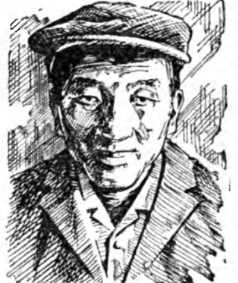
байрлажа, сэрэгтэй хургуули хэжэ эхилээ нэн.