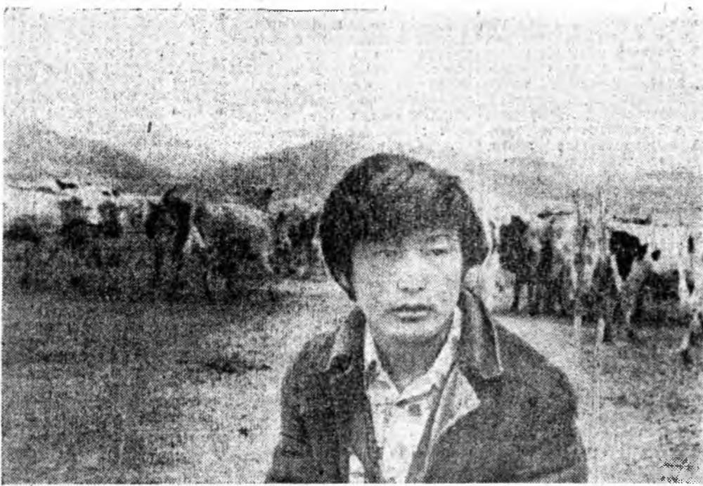
Тунхэнэй аймагай Сала- нан совхоз жэл бүри хэдэн мянгад эбэртэ бодо мал, адуу мордны холын тунга нооготой болшээрда гарга- жа, хямда сэнтэй тарган ма- жа хээр абадаг заншалтай.

Хяагтын аймагай «Друж- ба» колхозой Энэ тагын, Еха-Хударин наалин фер- мынхид Яруунын совхозой наалишад республикын малша- дай хуудалдан хандал- гые зүбшэн хэлсэлтэ, зунай дүрбэ харын туршада үнэн буринөө 1000 килограмм ху хааха уялта абаа.