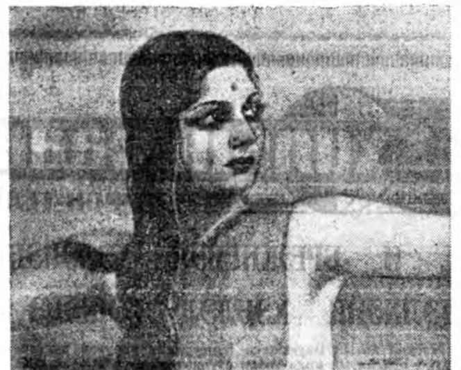
С. Рерих. «Роща Ваджифар». 1956 он.