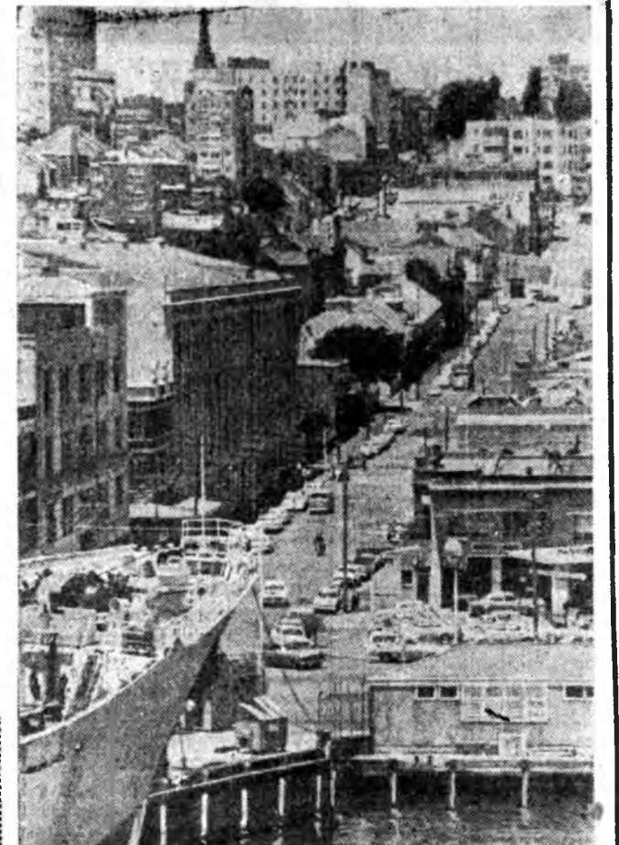
Сидней хадаа Австралийн эгээл томо город ба портуудай нэгэн юм. Тэрэ оронтой промшленна томохон түб болодог.

Нэгдэхэи хууданда: «Сагаан алтаа саг соонь хурал» — суглуулбары. «Түрүүлшын шата дабагдаба» — Г. Клепиковой статья. Хоёрдох хууданда: «Табан жалэй тусэб дүүргэдэхэ» — А. Игуменовэй статья. «Хүдөөгэй барилгада хэрэгтэй зүйлүүд» — Н. Владимировой статья. Түрэл орон доторнай. Гурбадах хууданда: «Мянган харган бэлшэр дээрэ» — интервью. Уласхоорондын шөнжэлэл. Хилын саанаана. Номой таг. Дурбадах хууданда: Сур харбаан дээрэнэ репортаж.