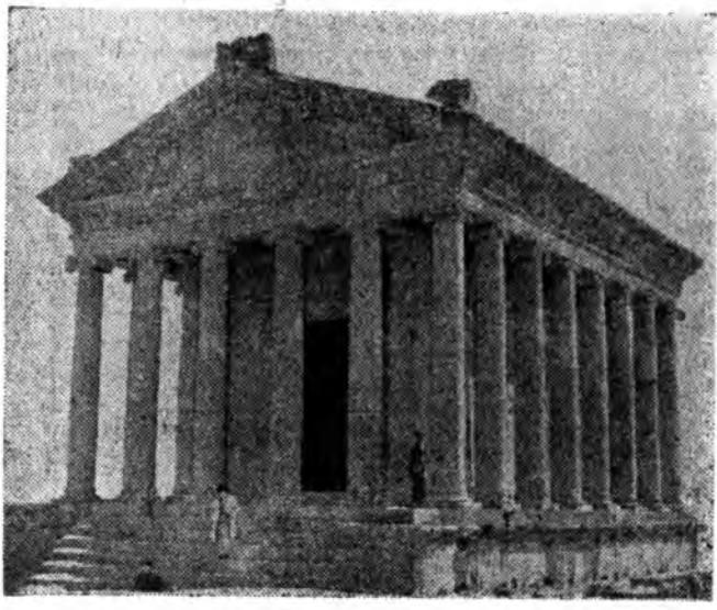
Ереван хототоо хори модо зайда оршодог Гарни гэжэ хүмэ шэнээр бодхоодоб. Эртэ ирдын харын шажанай хүмэ эрдэмтэд ба барилгачадай нарин гараар дахяад хуушанайнгаа тухэд малгыс оложо, шэнээр бодоо. Энэ хадаа Армениин архитектурын ирда сагай үзэсхэлэн гой барилануудай нэгэн юм.