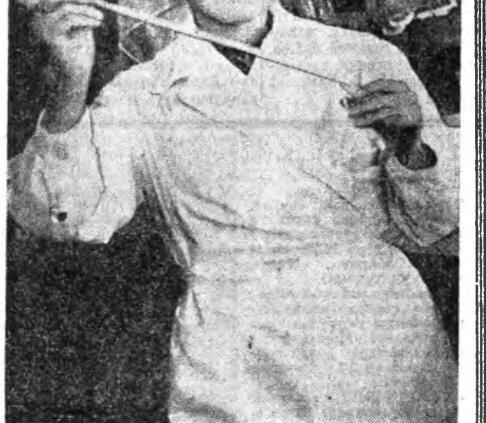
Н. В. ПОДГОРНЫЙ

«Союз—Аполлон» хадаа эрээдүн замбуулиной науна станицнуудтай эхн болоно гэжэ КПСС-эй ЦК-гай Генеральна секретарь Л. Н. Брежневтэй хуу бэлэн болонхой.