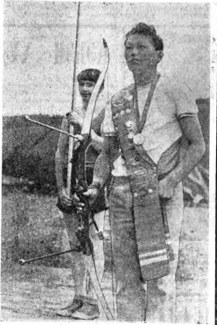
мада мартагшагүй гүнзэгш үдхатэй жэл болонон юм. Лениний партида орохоноо эхэ баяр, жаргал үгы.