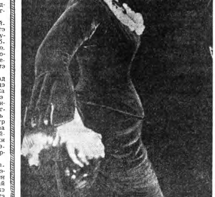
ЭКРАН ДЭЭРЭ — «ПОСЛЕДНЯЯ ЖЕРТВА»

Мүнөө жэлдэ найхан наруул классуудай үүдэн сэлгидэгж, үхбүүднэй урматгайгаар эрдэмэй харгыгаар давшан, ойлгогдоноүй юумые ойлгожо, ухаан болодоо гүнзэгэрүүлхэн гэгшэ.