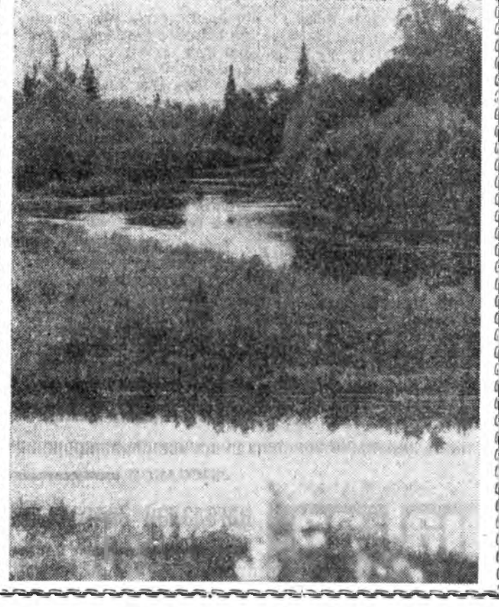
Аажам Бурядайм байгаали Аргагүй найхан даа.

дэгдэжэ, хуушан гуримдаа ороо ха юмби. Октябрьска райгүйсэдкомой дотоодын хэрэгүүдэй таһагтай мурдгашдэ ошоно, ГАИ-гай хүдэлмэрилгэши намайе буруу гэмнээ гэжэ гомдол бариваб.