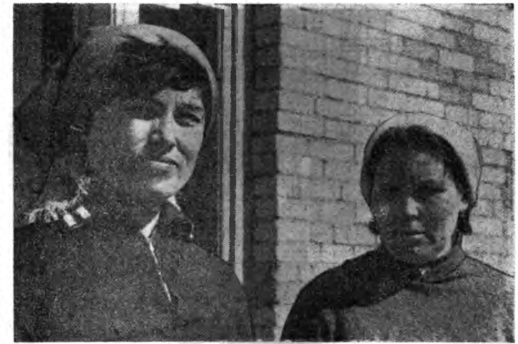
Бурядай барилгын управленин ажал тугуушүүл КПСС-эй XXV съездые утгуулан ажалай шэнэ амжалтануудые туйлана.

дые баригданай хөрөггүй, 90-нээ 140 хүртээр хууригтайгаар барилга хэзэ гэжэ дурадхаха.