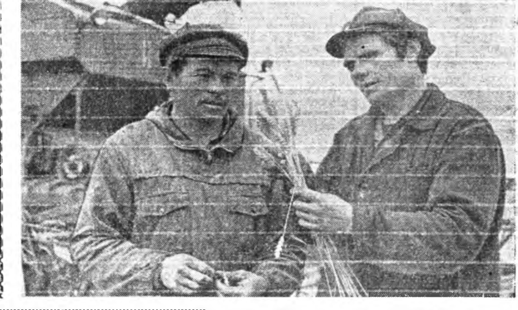
Хуряалга хуралдаж... Хуряалга хуралдаж... Хуряалга хуралдаж...