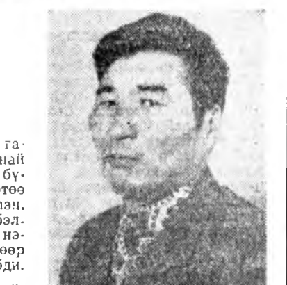
таа һан. Бултадаа шаху «тарган» гэһэн сөгнөлтгээтэй гэрэ абтаа.

Бэлшээрин дүнгүүдэй гаргадана, манай гүүртин малай толгой бүриин шэгнүүр сүүдхэдэ 1.372 грамм нэмһон байба. Тингээ энэ хабарта абанан улгаа 372 грамм аар үлүүдэ дүүргэбэ гэжээбди. Нимэ үр дүн анха түрүүшынхэ туйлагдаа. Табан жэлэй түгээхэ жэлдэ абанан улгаа ажалтагатайгаар дүүргэнэ хаалиша дунган шанда хүртэдэг юм.