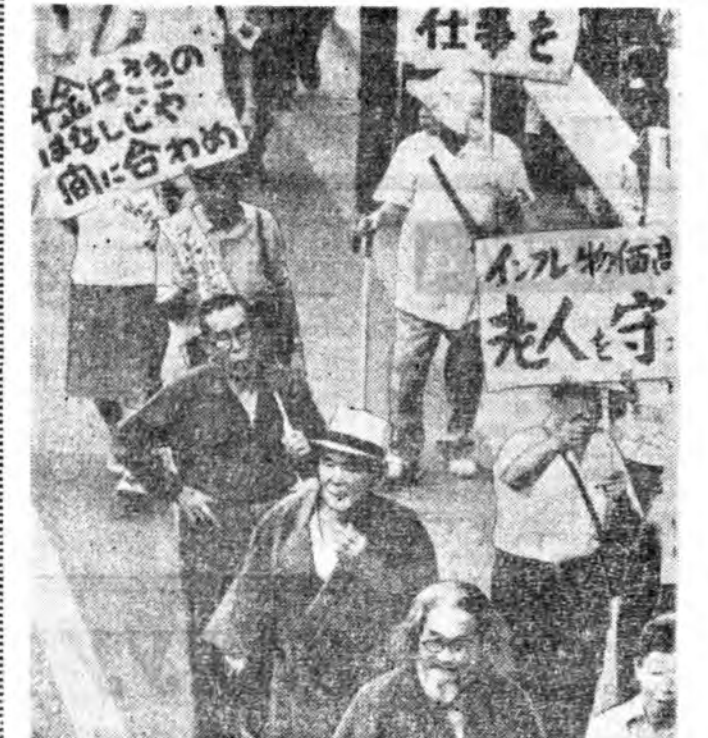
Баянхана Япондо үндэр нахатане хүндэлэн ямбалгалы үдэр үнэгэрэгдэбэ. Энэ үдэртэй дашарамдуулан, олон тоото хэмжээ аюулганууд үнэгэрэгдэбэ, амаршадны халуун үгэнүүд хэлэгдэбэ. Тэбэшье үндэр нахатанай байра байдал тулуур зандаа байһар.