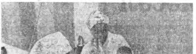
Африка түбдэ Анголын Арадай Республика гэжэ бөө даанхай шэнэ гүрэн мүнөөдөл. МПЛА-гай байгуулан курсануудай дун хамта 150 мянга гаран хур харуулаана. Энэ курсануудай гол зорилго хадаа эрдэм номгүй шүүдлэ өсөөрүүлжэ хэрэг мүн болоно. Заримдаа, энэ зураг дээрэ харуулагдашаад, зантйнуудын үйлсэдэ үнэргэгдэнэ.

«Спартак» бүлгэмэй түрүү хуури эзэлхын тулоо мурьсоондэ Улаан-Үдэ хотодо болоно дүүрэгтэ. Тэрэ бүлгэмэй түрүү хуури эзэлхын тулоо мурьсоондэ Улаан-Үдэ хотодо болоно дүүрэгтэ.