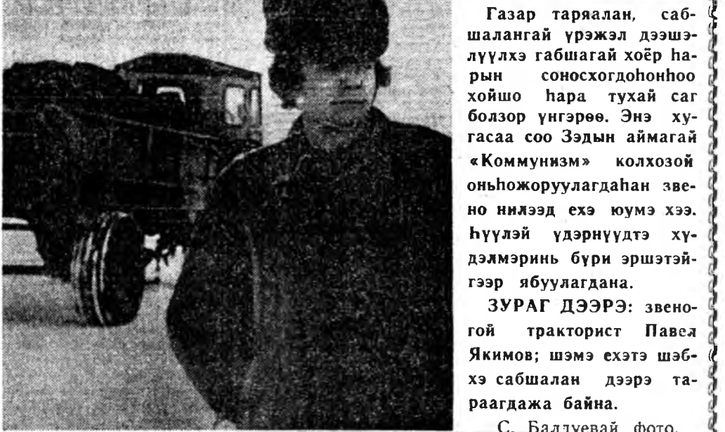
Газар таряалан, сабшалангай үржээл дээшлүүлэхэ габишаг хойр нарын сонсохгодононхоо хойшо нара тухай саг болзор үнгэрөө. Энэ хугасаа соо Зэдын аймагай «Коммунизм» колхозой оньхожоруулагдана звенонилээд эхэ юумэ хээ. Нүүлэй үдэрүүдтэ хүдэлмэринь бүри эршэтэйгээр ябуулагдана.

«Социалист уялгануудыг амжалтатгайгаар дүүргэхын тула шухала арга боломжо хангалтын түлөө, харьяата предпринятинуудын үйлдэбэрин юбуулгатай холбоотой бүхэ асуудалнуудыг хана саг соо шиндхэлгын түлөө эдэной харюусалгатай байханда министрүүдэй, албан зургаануудай, ажахын оргонуудай анхаралыг КПСС-эй ЦК хандуулаа».