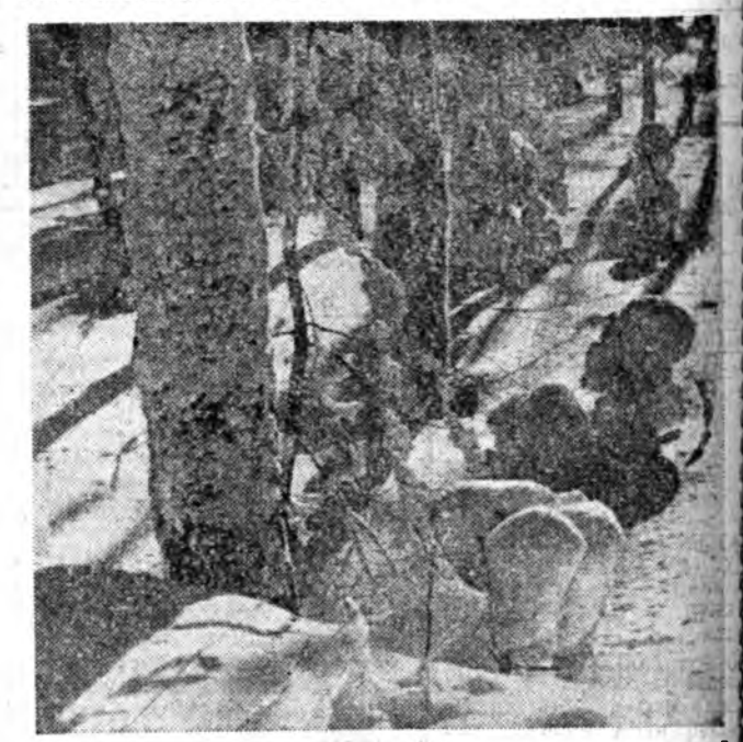
Үбэлэй үльгэр зүүдэ манадаг сэмхэг сагаан саһанай хада майла, хангай хүбшөөдө зузаан хүнжал болон хабарай ерөтэр хэбтэбэ гэшэ. Тэрэн дээрэ ан бүхэнэй муражын харагдана. Ой модондо наһагдаһай дэгэл хубсаан умэдхүүхэднэ, тэдэн элдэб шанжэ түхэлтэй болово, хүниһе гайхуула бшуу. Энэ хууданадаа П. Яхновецкийн бар тайга соо нахана хэһэн хоёр буулгабарни томибодна.

Бургаастайгаа талада гарахадан, Булдилжал зүрхэм дэбхэрхэ. Булагтайн горхоноо харахадан, Бурьяжал урдан эбхэрхэ. Нэрюун тэнюун нугьһини Нэбшээн, хаанаһин, үлэггүш.