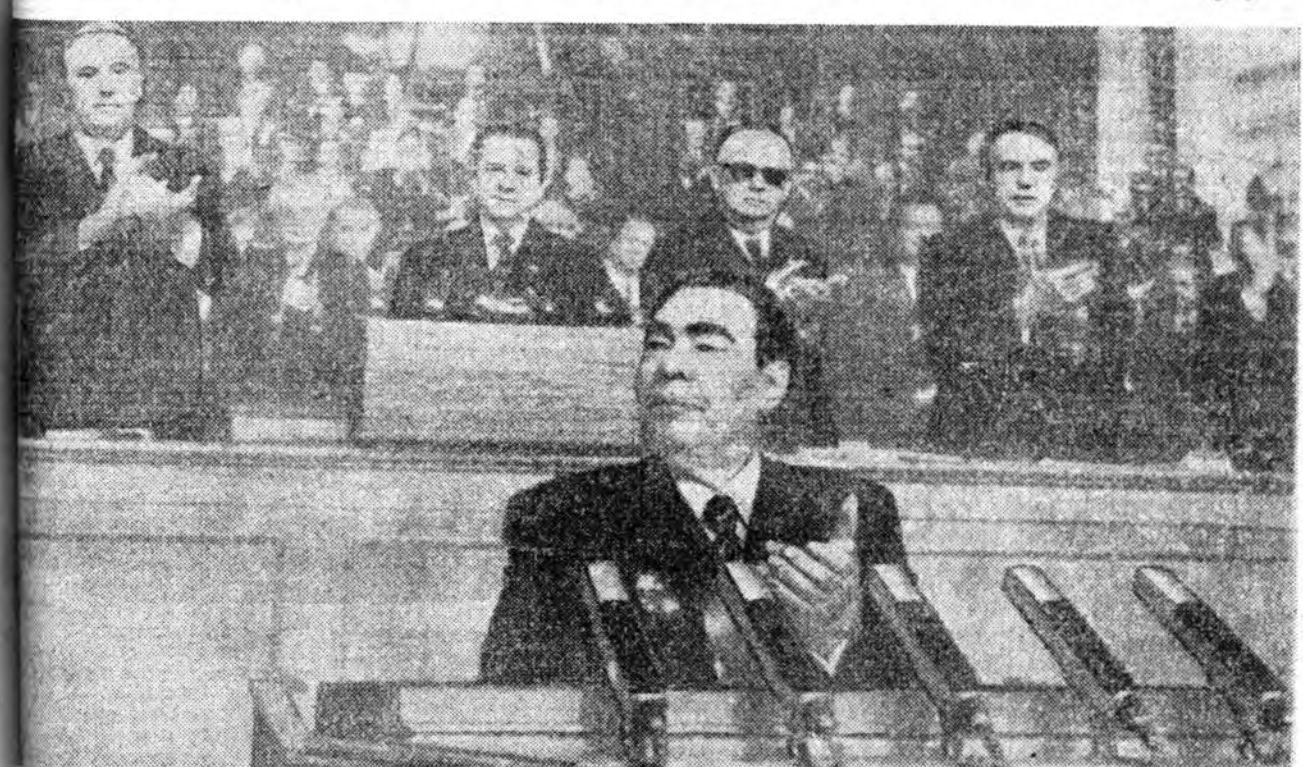
ВАРШАВА. ПОРП-ын VII съезд. АГ ДЭЭРЭ: КПСС-эй ЦК-гай Генеральна секретарь Л. И. Брежнев үгэ хэлэжэ байна. Энэ зураг фототелеграфар абтаа.