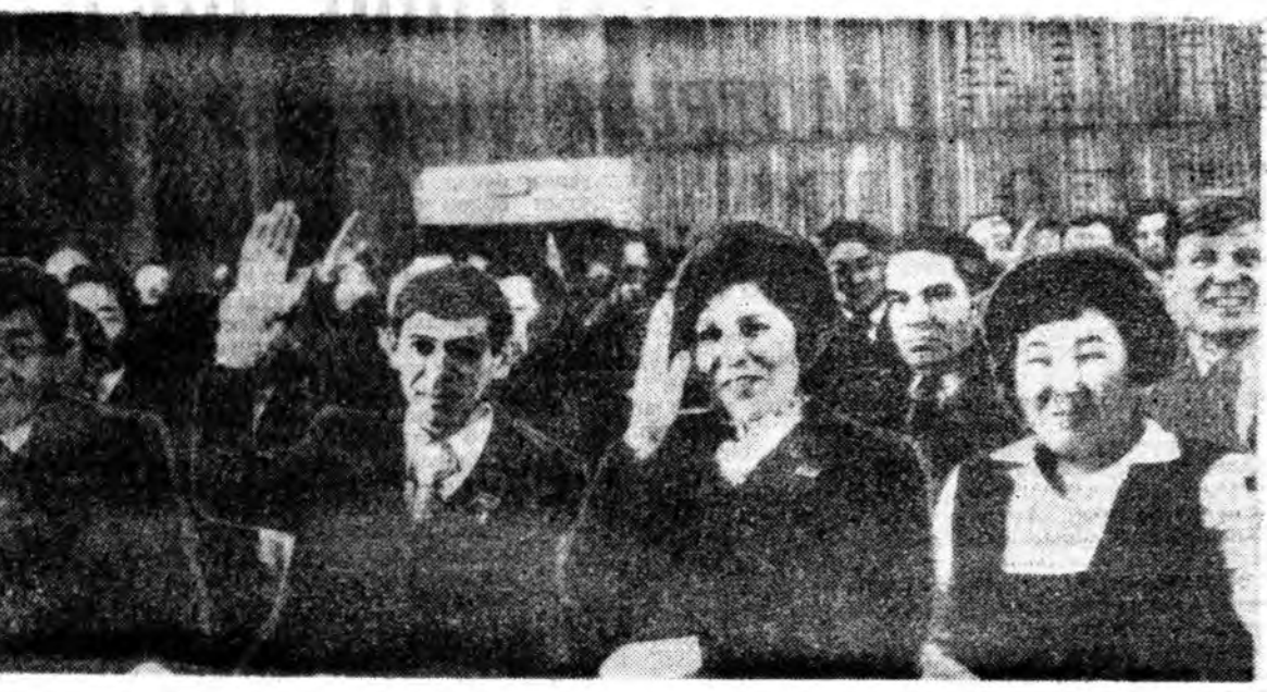
ЗУРАГ ДЭЭРЭ: республиканы Верховно Соведей сессин заседаниин зал соо.

Гэхэтэй хамта республиканы модо бэлдэхэдэй юндэжэ табан жэлэйгэй түсбэ дүүргэжэ, үзүүр хуулиа, гэгээрэлдэ хэрэгтэй барилганууд сэг болзортоо ашагалдаа үтгэнэгүй.