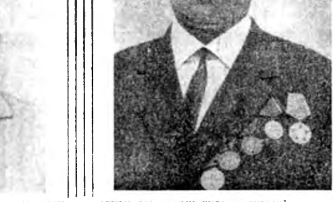
1974 ондо Загарайн аймагай Советтэ депутаттар хунгадан байха.

Нүгөөд хонинш Даша Танхаевай харууладга отара 40 хурьгадаар олошороо. Тэрэ 100 эх хонин бүриһөө 95 хурьга абхаа харалла. Б. ЛАЙДАПОВ. Хори.