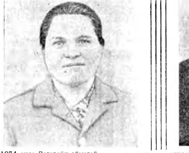
1974 ондо Загарайн аймагай Советтэ депутаттар хунгадан байха.

Түмэр замые забарилга шагнаа гадна, тэрэнэй бүтэн бүринис хинан шалгаһан эдэ олон юм. Жэжээлдэ Н. Я. Александров оператор-дефектоскопист гэжэн мэргэжлэй. Түмэр харгыгаар жүжэн, багахан тэрэг түлжэ, муудаһан, гантаһан гацарнуудын нарин нягтаар шалгана, элирүүлээ. Энэ нүхэрнай харгы хинан шалгалтын талаар 115, дутуу дунданууды элирүүлгын талаар түсөөб 100 процент дүүргээ. Тинн гансал 1975 ондо түмэр зам дээрэ 354 дутуу дунданууды элирүүлээ.