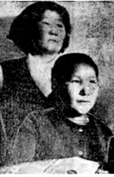
Бурядай АССР-эй Верховно Советдэ Президиумэй Указ