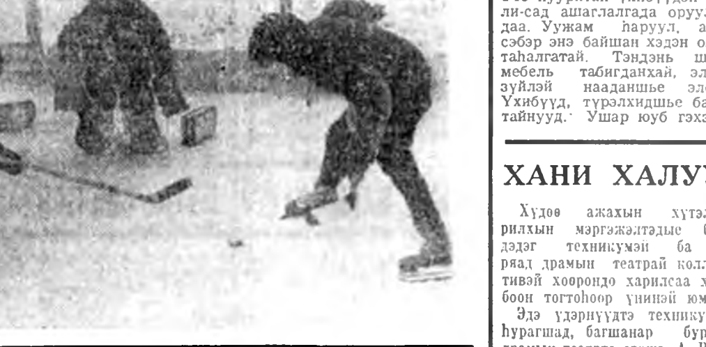
Улаан-Удымнэй кваргал бүхэдэ хүүгэдэй сүлөө сагтаа һолжоржо наадахын тула мүлһын талмайханууд бэлдэгдэжэ.

Инимэ хубуудэй баатар хуртыге, нэрэ солын аймагтай ажалшадай нангинаар сахид байһаниннь гайхалгүй. Декабристуудай буһалгаанай болоһоор 150 жэлэй ойе тэмдэглэхэ үедэ аймаг дотор олон хэмжээ ябуулганууд үнгрэгдөө.