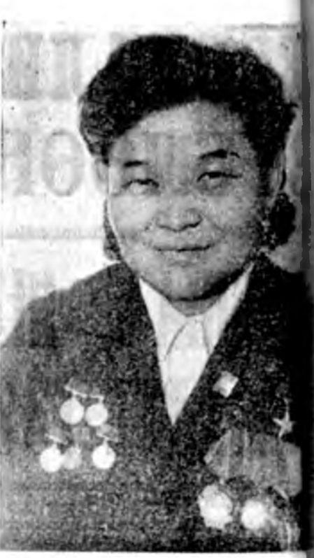
Эдинцэ болоно. Белогой дун мочевнэ үгэжэ хусалдуулна. Эхэдэ үдэр соо бага багаар аад, дахин таалажа үгэнэ. Тинхэдэ үнэн гүеи дуури эхнэ шадана. Унээдэ нэгэ талаанай хүүлээр түрүүшүн 7—10 тэдэнэ үдэрэй 4 дахин хаана. Хүүлээр хаажэ ороно. Унээ бүрнөө шадарга хаана, ехэ гугуулаша шууха. Тинхэдэ үдэрэй үнээдэ түрүүн хаажэ, гараа Унээдэ тун хатуу дэлэнтэй үнээдэ хаажэ гариш шалангүй. Эгэнэ хүүлээр хаагдадаг үнээдэ ороно. Унээдэ нэгэ эдэзүүлжэ, хааха гэжэ тон шууха үгэжэ Лазаревна тоолоно. Түрүү хаагдай дүршээлэ бусад хаалцалдай өйлөө хаалин үнэн бүрнөө үгэжэ. Тинхэдэ үдэрэй үнээдэ халан абалтан хаалин өөршөө бэлэй бэшэ хуунаа.

1970 ондо үнэн бүрнөө 3000 килограммаар дээш хуунаа хаалцсан республика оройдоол 14 хүн байгаа. Тэдэнд төсө Социалистик Ажалал Герой Надежда Лазаревна Тавашкина оролсоо бэлэй. Харин мундо тэдэ шэжээн хуура 71 хаалцан хаана. Тинхэдэ Надежда Лазаревна бүрнөө ургагша дабан гараа. 5000 килограммаа дээш хуунаа боллоо. Иймд ехэ амжалта Тавашкинаа өөрөө эрэгүүн. Энэ хадаа туйлайт ехэ оролдосо, тэмцэлэй, ажалал аша үрэгээш.