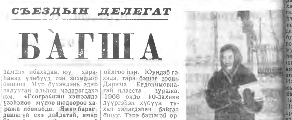
СЪЕЗДЫН ДЕЛЕГАТ БАГША