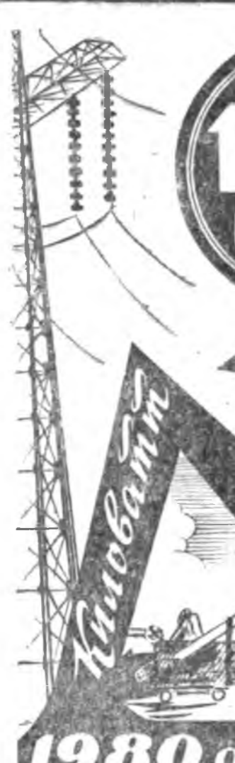
1980 ондо хүдөөдэ электрын элшэ хүсэ хэрэглэлыг 130 миллиард киловатт-час хүрэтэр ехэ болгохо.

Партиин XXV сьезддэ гаргаһан «СССР-эй арадай хүжөөхэ гол шэглэлүүдэй» зорюулжа КПСС-эй ЦК-гай гаргаһан «1976—1980 онуудта проектээ».