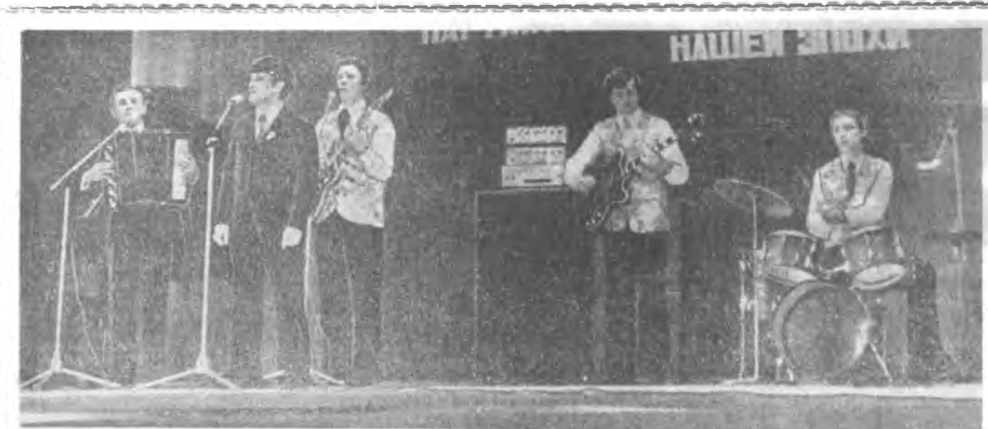
Уран найханы бүхэсөөн фестиваль