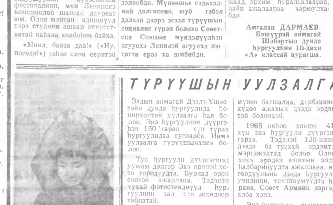
Манай эдир космонавт! Эзимнай мүнөө дээрээ Элдин түрэл дайладаа Бургаанан мори унахай Буряадай баатар космонавт!