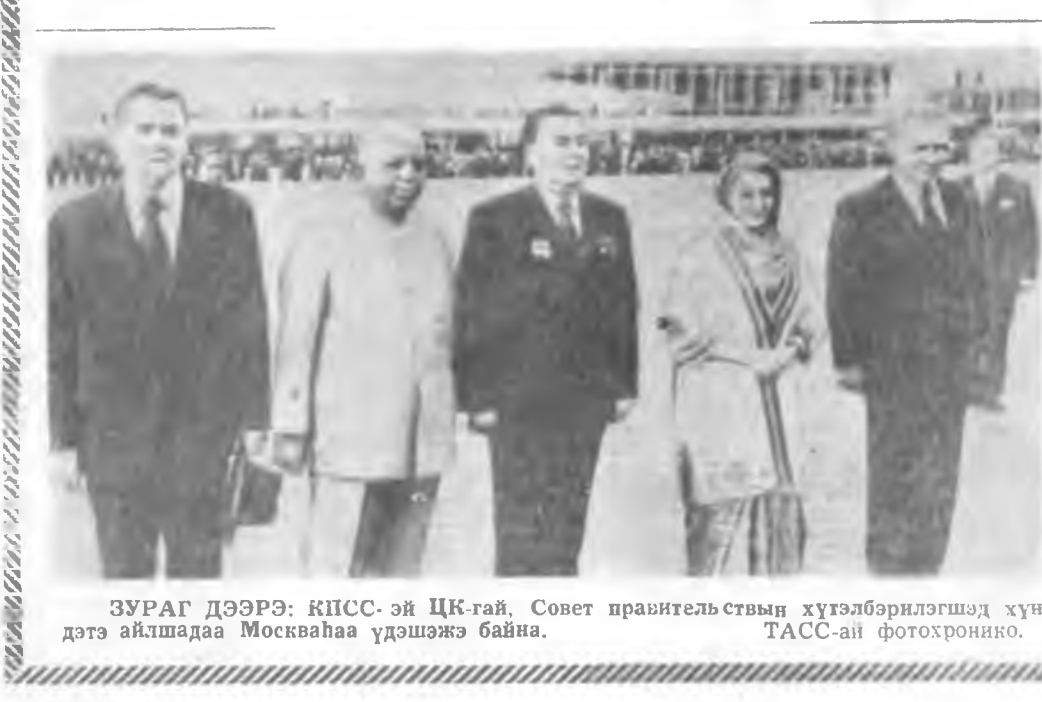
ЗУРАГ ДЭЭРЭ: КПСС-эй ЦК-гай, Совет правительствын хүтэлбэрлэгшэд хүндэтэ айлтадаа Москваһаа үдэшбэ байна.