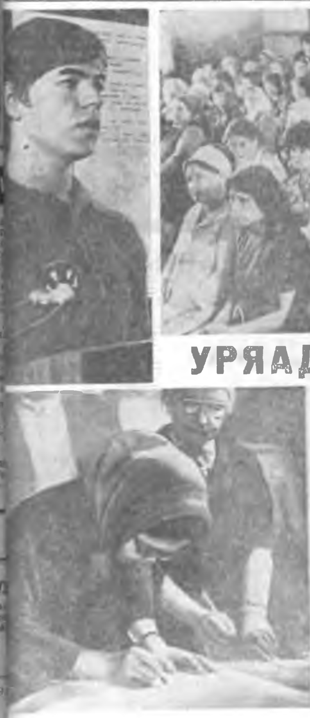
УРЯАДА ГАР ТАБИНА

ЗУРАГУУД ДЭЭРЭ: гар табилгын үедэ.