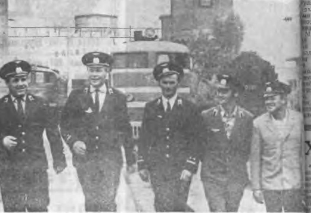
Электровозуудыг сүүдхэдэ 1.000 километртэ ябуулжа, арадай ажахыда хэрэгтэй ашаа эхээр шэрэхэ гэһэн мурьсөөндэ Улаан-Удйн локомотивна депогой машинистнууд оролсодо, хаба шадалаа гаргана.

Электровозуудыг сүүдхэдэ 1.000 километртэ ябуулжа, арадай ажахыда хэрэгтэй ашаа эхээр шэрэхэ гэһэн мурьсөөндэ Улаан-Удйн локомотивна депогой машинистнууд оролсодо, хаба шадалаа гаргана. Депогоймнай машинистнууд, машинистнуудай туһалагшад хубинн уялга абадаг юм. Тэдэнэр «Минни табан жэлэй гэгээн дэбэртэй. Хэһэн ажал, хэрэг тухайн, нингын хэрэгтэ ямарар хабаадасанаб гэжэ мэтэ энэ дэбэрт соо сум бэлэгдэдэг. Нарын дүүрэхэдэ, худэлмэришэд өөһэдэ хуужа, хэһэн ажалтайгаа дун гаргадаг. Найнаар худэлмэришэд эдэхитэйгээр хабаадасанаб худэлмэришэд түрүү буури эзэлжэ, мунгэн шаангаар турмашуулагдадаг. Иониня дүрмүүдыг электромашинна, локомотивуудыг ажуулагдаг цехүүдэй коллективнууд түрүү буури эзэлжэ, дамжуулгын Улаан тугуудыг мунгэн шаангаар абаһан байна. Удэр хонгойо ошохо тума мурьсөөндэ эршэ улам шаандала. Түмэр замшалай ажалтайгаар утгажа байхадаа, ашаг урын, худэлмэришын шаанарай табан жэлдэ шөөл хайнаар худэлмэришэд гэжэ түмэр замшалай үмэнхэй хэлэхэ дуран хэрэгэ. А. ШЕЛКОВНИКОВ, Улаан-Удйн М. И. Калининэй нэрэмжэтэ локомотивна депогой парткомы секретария орлогшо.