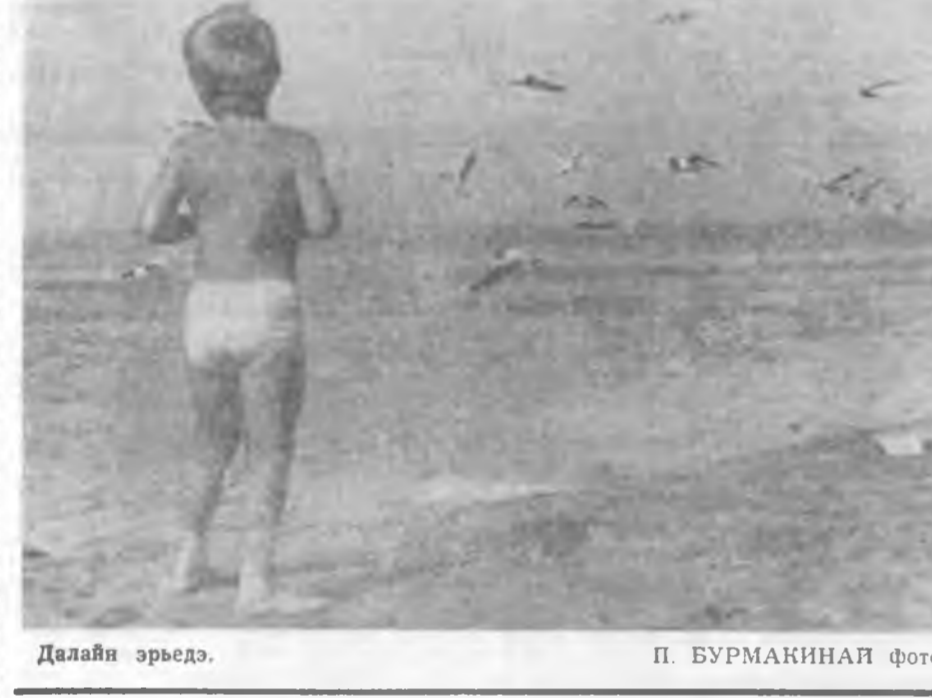
Далайн эрьдэ.